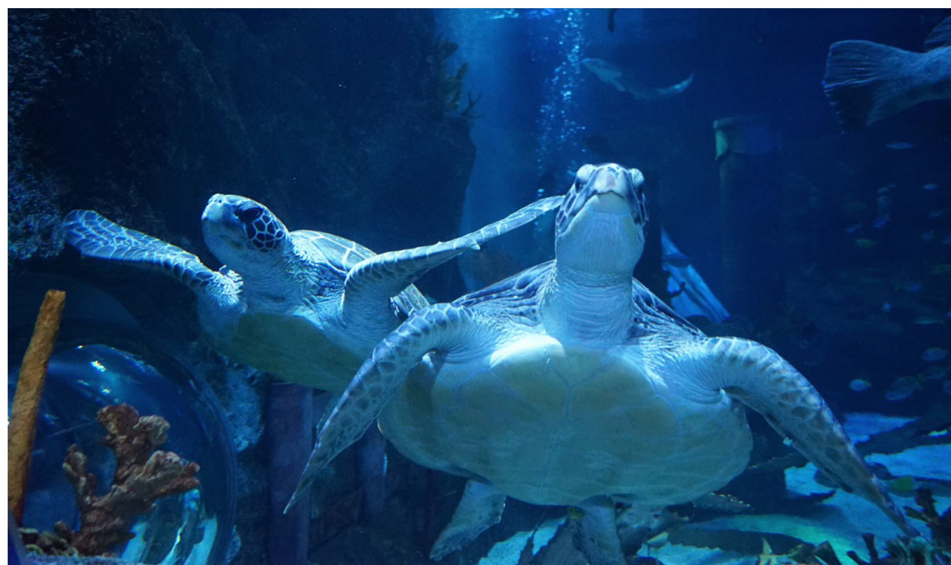
シーライフ名古屋で治療を受けた2匹のアオウミガメ

例えば、高知県で保護された後、当館で治療を行った2匹のアオウミガメのフンに、実際に含まれていたプラスチックごみを用いて、汚れてしまった海が、動物に与える影響について紹介します。