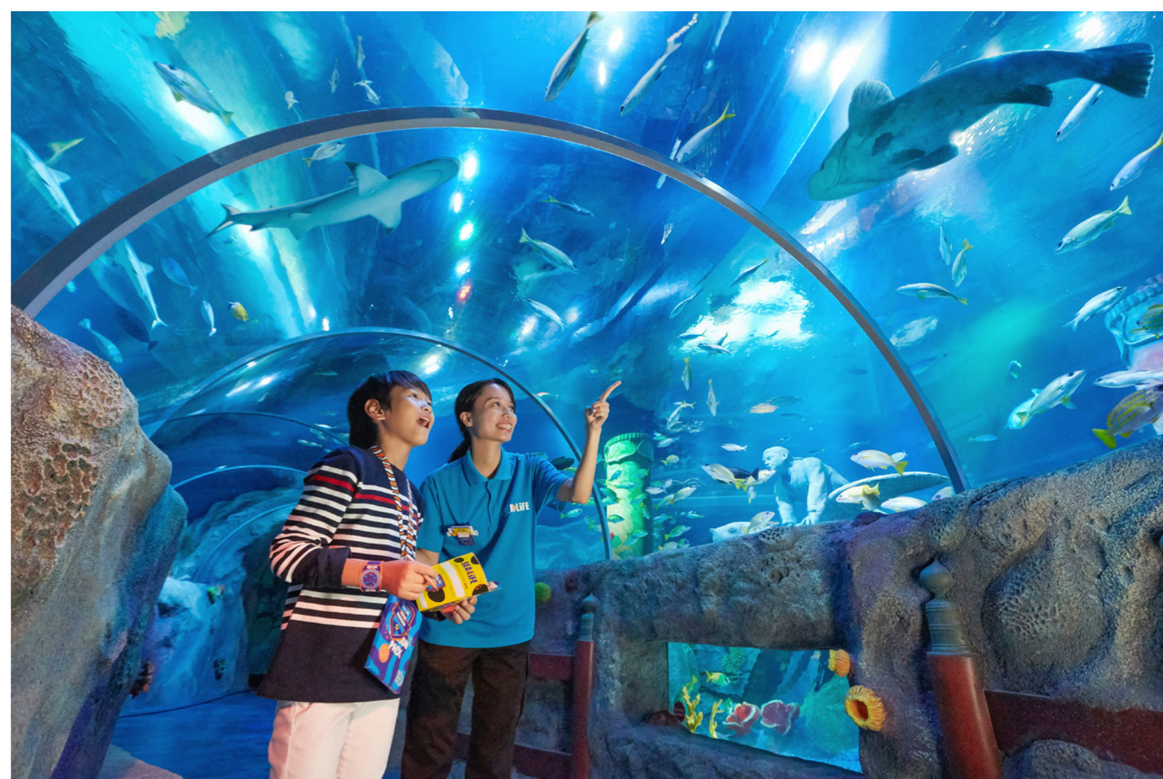
竜宮城へ続く海のトンネル

さらに、『シーライフ名古屋』では、SDGsの目標14“海の豊かさを守ろう”を達成するために、レゴ®ブロックを使ったワークショップで、プラスチックごみで汚れた海をきれいにする体験ができます。