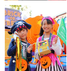
※写真は以前の様子

2021年、レゴランド®・ジャパンのハロウィーン「ブリック・オア・トリート (Brick or Treat)」<10月2日(土)～11月3日(水・祝)開催>は、ここにしかない家族の思い出作りをお手伝いします。レゴ®の人気シリーズ『レゴ フレンズ』の世界観の中で“親子史上、最高にかわいい”ハロウィーンの写真が撮影できるシーンと、日常の中では体験できない親子のかわいいハロウィーンをお楽しみください。期間中仮装してご来場いただいたすべての皆さまに、お菓子の詰め合わせをプレゼントします！