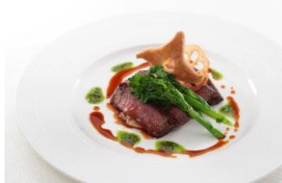
オーストラリア産アンガスビーフ、 フィレ肉のポワレ Ninja スタイル・煙のマジック

ぜひ、ご家族そろって『LEGOLAND® Japan Hotel』で食事やアルコールをお楽しみください。