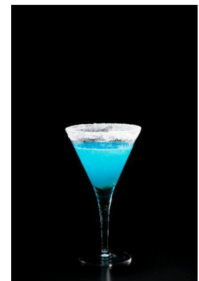
ザ・スカイライン 900 円