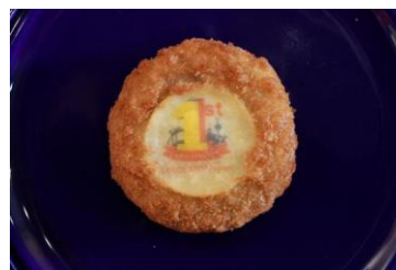
1st アニバーサリーコロッケ