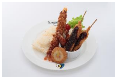
大名古屋プレート (エビフライ・串カツ・