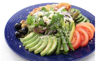
スカイライン・バーシェフのサラダ L 1,400 円