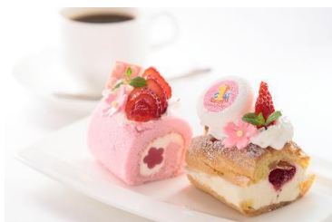
左 SAKURA ロールケーキ

『LEGOLAND® Japan』開業1周年を記念して、3月21日(水・祝)から特別メニューが登場しました。桜をイメージしたスイーツなど春らしいメニューが揃っています。