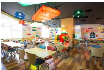
ブリックス・ファミリーレストラン

『LEGOLAND® Japan Hotel』は、外観から内観に至るまでレゴ®ブロックの世界が広がるホテルです。ホテル内には、宿泊者だけではなく訪れるすべての方がご利用いただける「ブリックス・ファミリーレストラン」と、「スカイライン・バー」がございます。