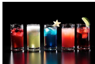
スカイライン・バーのお子さまも 楽しめるノンアルコールカクテル