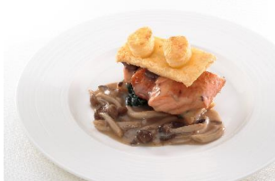
アトランティックサーモンとほうれん草、 クリームマッシュルームのブリックパイ