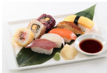
お寿司の盛り合わせ 1,400 円