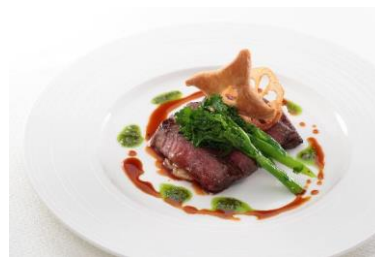
オーストラリア産アンガスビーフ、フィレ肉のポワレ Ninja スタイル・煙のマジック 3,200 円