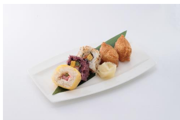
お花見すしセット