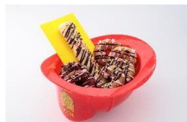
ハッピーデザートコンボスーベニア