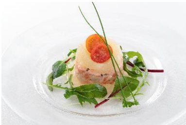
シーフードタルタル、グレープフルーツのジュレを添えて 柑橘の香り 1,200 円

日本産や愛知県産にこだわった食事や、色鮮やかなカクテルなどをご提供するバーです。昼食と夕食の時間帯に営業し、前菜やディナー・メニュー、そして様々なビール、ワイン、スピリッツをご用意しております。