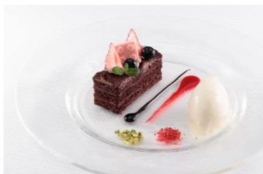
チョコレートケーキバニラアイスクリーム 添え、2色のソース 600 円