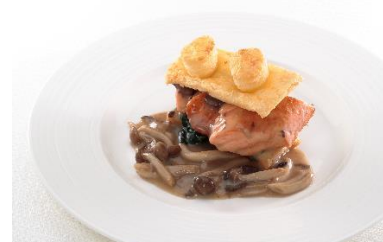
アトランティックサーモンとほうれん草、 クリームマッシュルームのブリックパイ 1,600 円